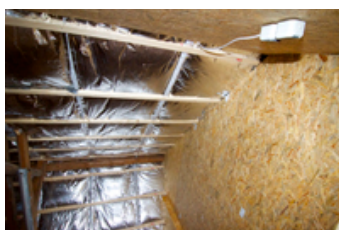
Dämmung im Satteldach